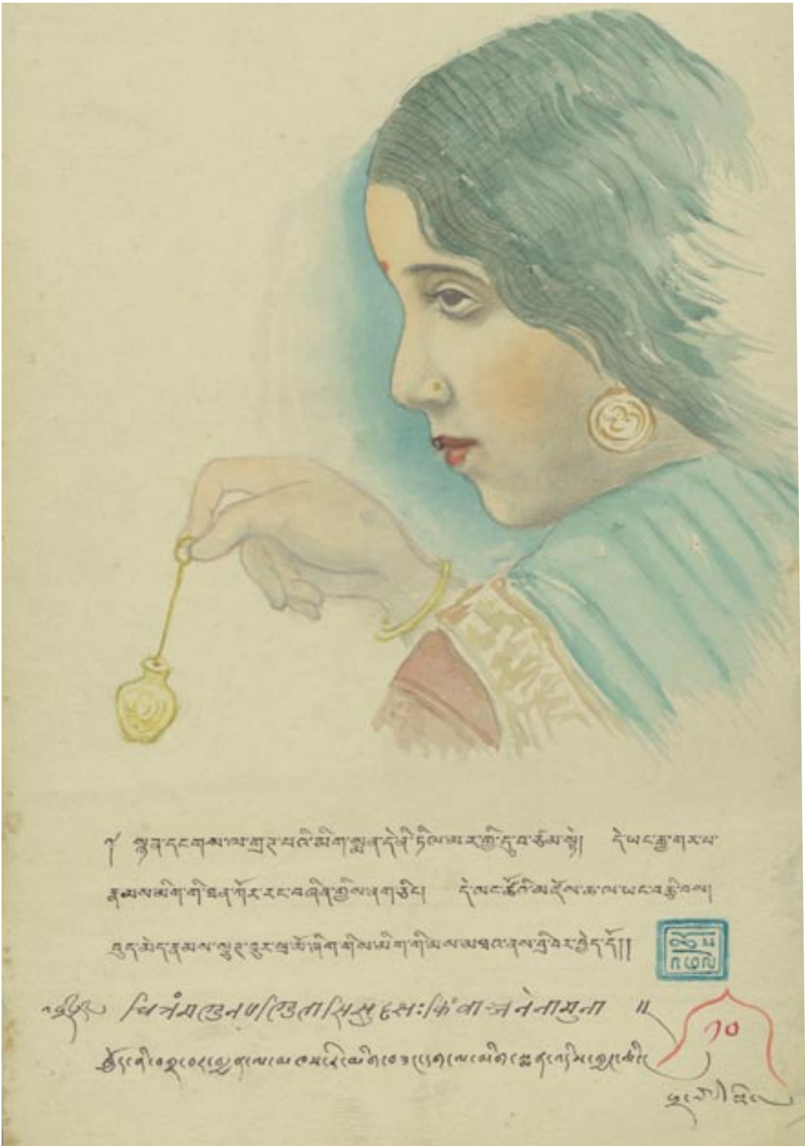
མུ་བྱམས་ལགས་ནས་གཅེས་ཉར་གནང་ཡོད་པའི་དགེ་འདུན་ཚེས་འཕེལ་གྱི་ཚུ་ཚོན་རི་མོ་ཞིག གནས་ཚུལ་ཞིབ་བྱས་ཤོག་རོམ་ ༡༡ ལ་གཟིགས།

A watercolor illustration by Gedun Choephel in the Pema Byams Collection. (See related article on p. 11.)